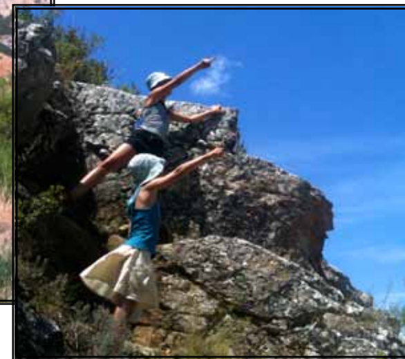
V.l.n.r.: Uitzijkend over het Spaanse Bilbao. * Camperplek in Puente la Reina (Spanje). * Wandelen door de bergen in het Spaanse Foz de Lumbier. * De meiden op de rotsen.

riet – dat geeft je bij het instappen meteen een strand- of vakantiegevoel. De camper zelf kostte € 7.000 en Dave heeft er daarna nog ongeveer € 8.000 in gestopt om ’m geschikt te maken voor langere reizen: vaste bedden, elektronica en ga zo maar door. Ook moest hij zijn groot rijbewijs halen, want je mag met een gewoon rijbewijs niet in zo’n grote camper rondrijden. Grote uitgaven, maar dat is allemaal heel geleidelijk gegaan. De hoogste kostenpost nu is het verbruik van de auto, maar voor de rest hebben we het soort budget dat mensen normaal ook